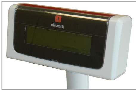
Display cliente grafico remotizzato